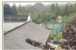
吊车斗车砸进教室