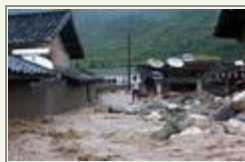
四川凉山发生泥石流