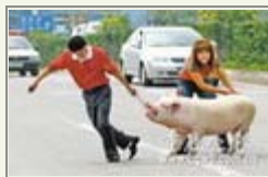
猪贩拉猪险象环生