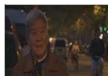
老人7千退休金买房难

浙江政协委员涉嫌洗钱 患者询问病情 医生让上网搜索 宝宝怕打针躲墙角萌爆网络 “神仙奶奶”12年不吃