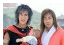
忍俊不禁的神字幕

武汉江岸道路每夜洗5遍 大学生不堪压力抢手机被抓 通州一男子砍死妻子岳母后自杀 空姐偷拍同事私照被停飞