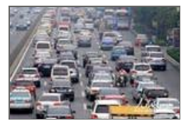
“逆行哥”开三轮车上高架