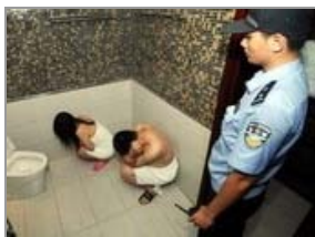
扫黄现场：小姐裸身被擒