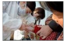
实拍DNA亲子鉴定全过程