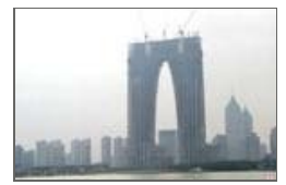
中国多个城市造型奇特建筑