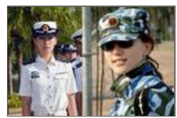
实拍军训中的女教官