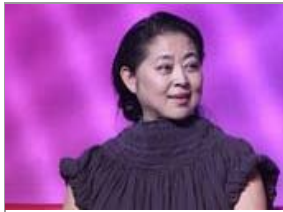
图揭被岁月糟蹋了的女星