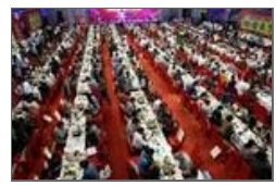
无锡千人共赴火锅宴