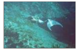
盘点史上最受争议照片