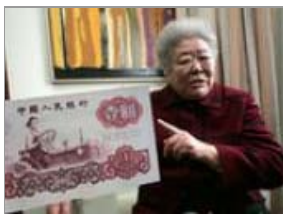
人民币上人物真有其人