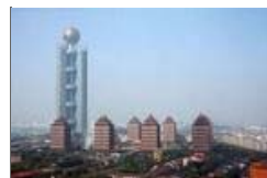
中国最有钱的六个村镇

今天是重阳节,昨日,北京市老龄办印发《北京市2011年老年人口信息和老龄事业发展状况报告》。截至2011年底,全市户籍总人口1277.9万人,其中,60岁及以上老年人口247.9万人,占总人口的19.4%,逼近五分之一。