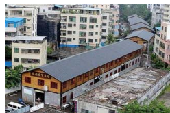
海口“最美”违建：如同火车贯穿市区规划路