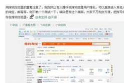
用户吐槽搜狗浏览器漏洞 登录他人淘宝似随意门