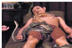
印尼另类蟒蛇按摩服务 顾客：肾上腺素狂飙(图)