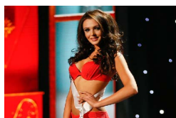
环球小姐预赛 佳丽比基尼亮相 秀曼妙身材