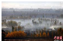
京郊晨雾炊烟宛若水墨仙境