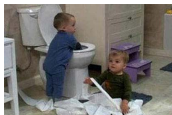
让父母无语的“熊孩子”