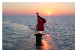
中国核潜艇解密背后