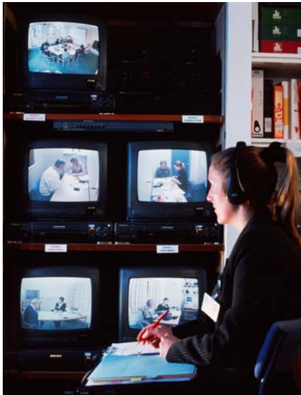
远程医疗会诊中心(e)

燕达国际医学研究院(c)，是一所国际化、现代化、开放型的新型医学研究机构。依据健康城的总体规划要求，在“立足长远，稳步发展”的原则指导下，通过搭建系列高端技术平台,引进大批国内外优秀专家和尖端技术，实施有效的国际化科研团队资源的整合，广泛开展干细胞、组织工程、各种体细胞治疗、基因治疗、靶向治疗、分子诊断等世界前沿医学技术的科学研究，衔接引进本集团医学科学研究「转化医学系统(c)」，支持燕达国际医院转化实施 ICBP 的整合医学新模式(e)(e)(e)。