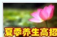
不同人群平安度夏方法