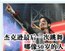
去世前两天的彩排录像曝光