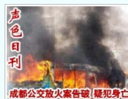
成都公交放火案告破 疑犯身亡