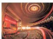
为党的“十四大”会议供应食品