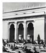
为党的“八大”会议供应商品

从1956年开始，34号担负历届党中央、国务院重大国事活动、重要会议及国庆阅兵等食品专供任务。