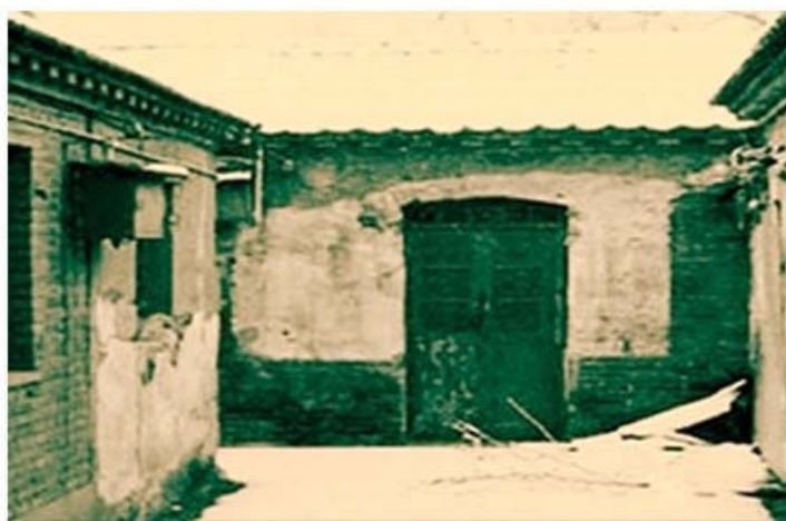
1956年的锡拉胡同34号院

这是食品供应处所属的第一个企业，承担着中央首长、外宾及重要会议的食品供应任务。在这个普通而又简陋的院落里，干部职工支起了简易的大罩棚，在因陋就简中肩负起了光荣而艰巨的责任。