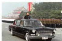
为国庆阅兵供应食品

老一辈创业者白手起家从供应处筹建到投入运营，只用不足半年时间。在那个食品短缺、供应