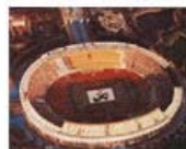
为第十一届北京亚运会供应食品