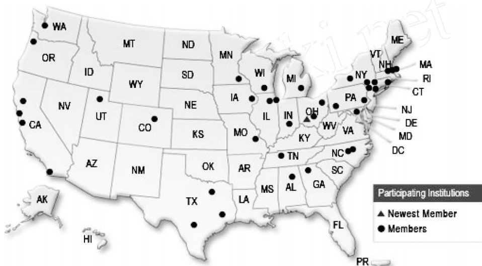
图 1 获得 CTAS 资助的医学研究机构分布情况

目前,已有 23 个州的 39 家医学研究机构获得 CTAS 资助,从事临床与转化科学研究工作(图 1)。2008 年 NH 投资 4.62 亿美元用于该计划,约占 NH 当年预算资金的 1.60%。预计到 2012 年,CTAS 资助机构数达 60 家,年度资助 5 亿美元。 [1-2]