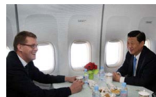
习近平会见芬兰总理万哈宁