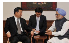
回良玉会见印度总理